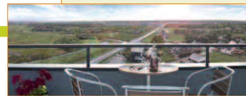
Wordt dit ook uw uitzicht?

meter, en staan garant staat voor schitterende uitzichten. Begin juni wordt het hoogste punt bereikt dat op feestelijke wijze zal worden gevierd. Geïnteresseerden krijgen die dag de mogelijkheid om van het uitzicht te genieten. Benieuwd hoe goed u de Utrechtse Heuvelrug kunt zien liggen?