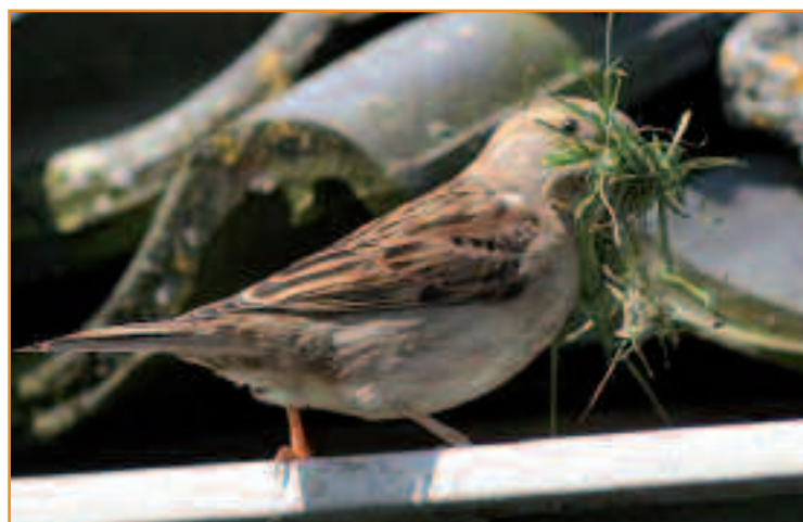
Hoort u ze al fluiten?

Alle tuinbezitters in de wijk Veenendaal-oost krijgen een informatiepakkert waarmee ze opgeroepen worden de tuin zo natuurvriendelijk mogelijk in te richten. Voldoet de tuin aan die criteria van natuurvriendelijkheid? Dan vormt die tuin een groene stapsteen voor plant en dier en krijgt het Groene stapsteen certificaat. Meerdere natuurvriendelijke tuinen bij elkaar in een straat vormen samen een kleine groene stadsbiotoop en zo'n straat kan dan het certificaat Groene straat krijgen.